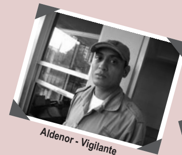
Aidenor - Vigilante