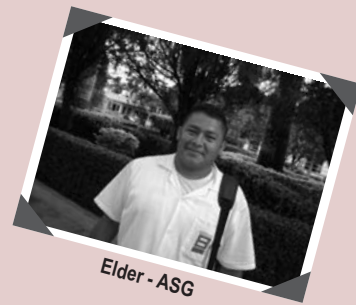
Elder - ASG