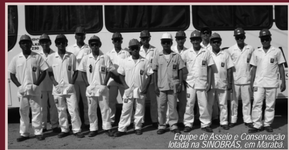
Equipe de Asseio e Conservação lotada na SINOBRAS, em Marabá.