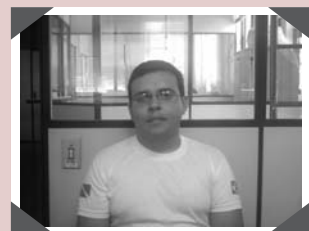
Anderson - Vigilante