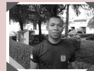
Mafra - Vigilante Escolta