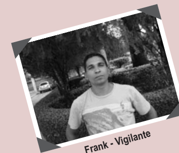
Frank - Vigilante